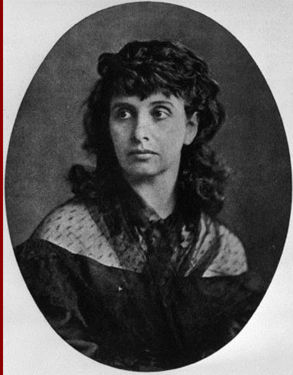
Hedwig Dohm 1831-1919, Schriftstellerin, Frauenrechtlerin